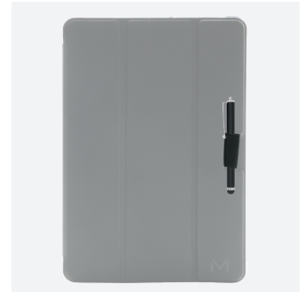
Stylet non inclus